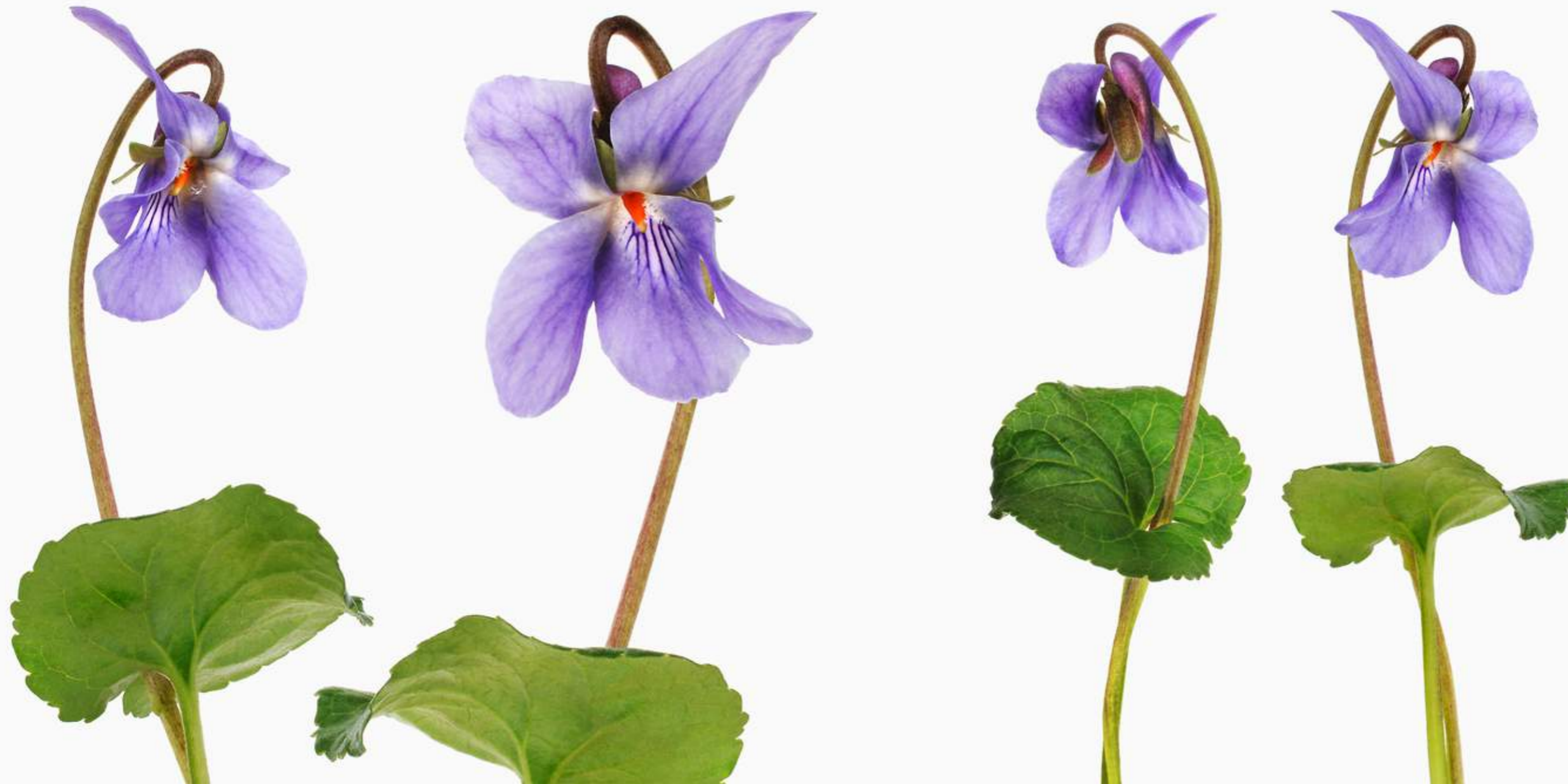
Viola odorata 'John Raddenbury'

Duftveilchen. Diese Züchtung stammt aus Australien von 1895. Die Sorte ist nach dem ersten Direktor des Botanischen Gartens in Melbourne benannt. Die Blüten sind eher hellblau mit dunkelblauer Aderung und kleiner weißer Mitte. Der Duft ist umwerfend. Die Blüten sitzen auf langen Stielen, weshalb die Sorte auch als Schnittblume angebaut wurde. Eine Besonderheit ist die Nachblüte im Herbst.