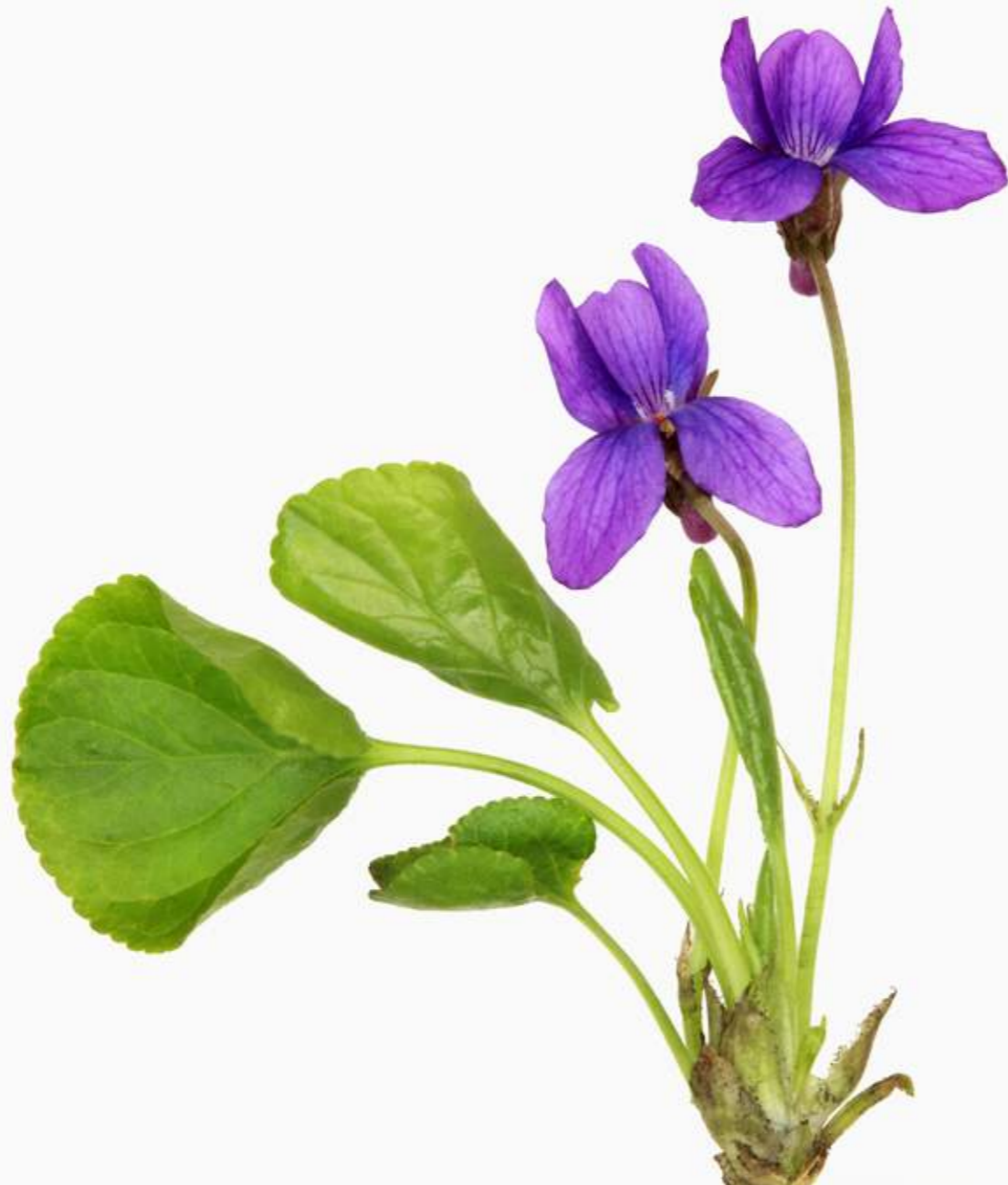
Viola odorata 'Königin Charlotte'