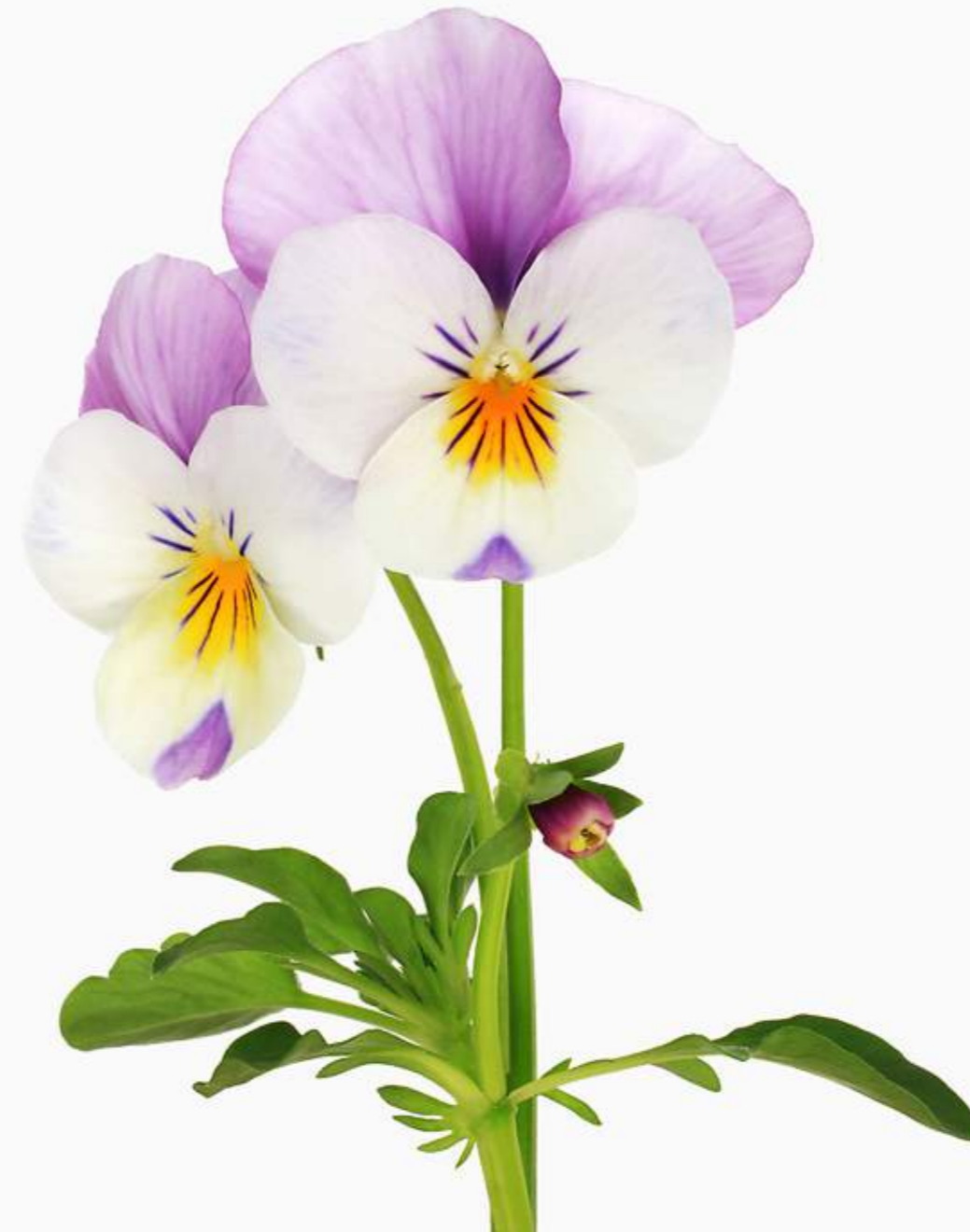
Viola cornuta -Hybride