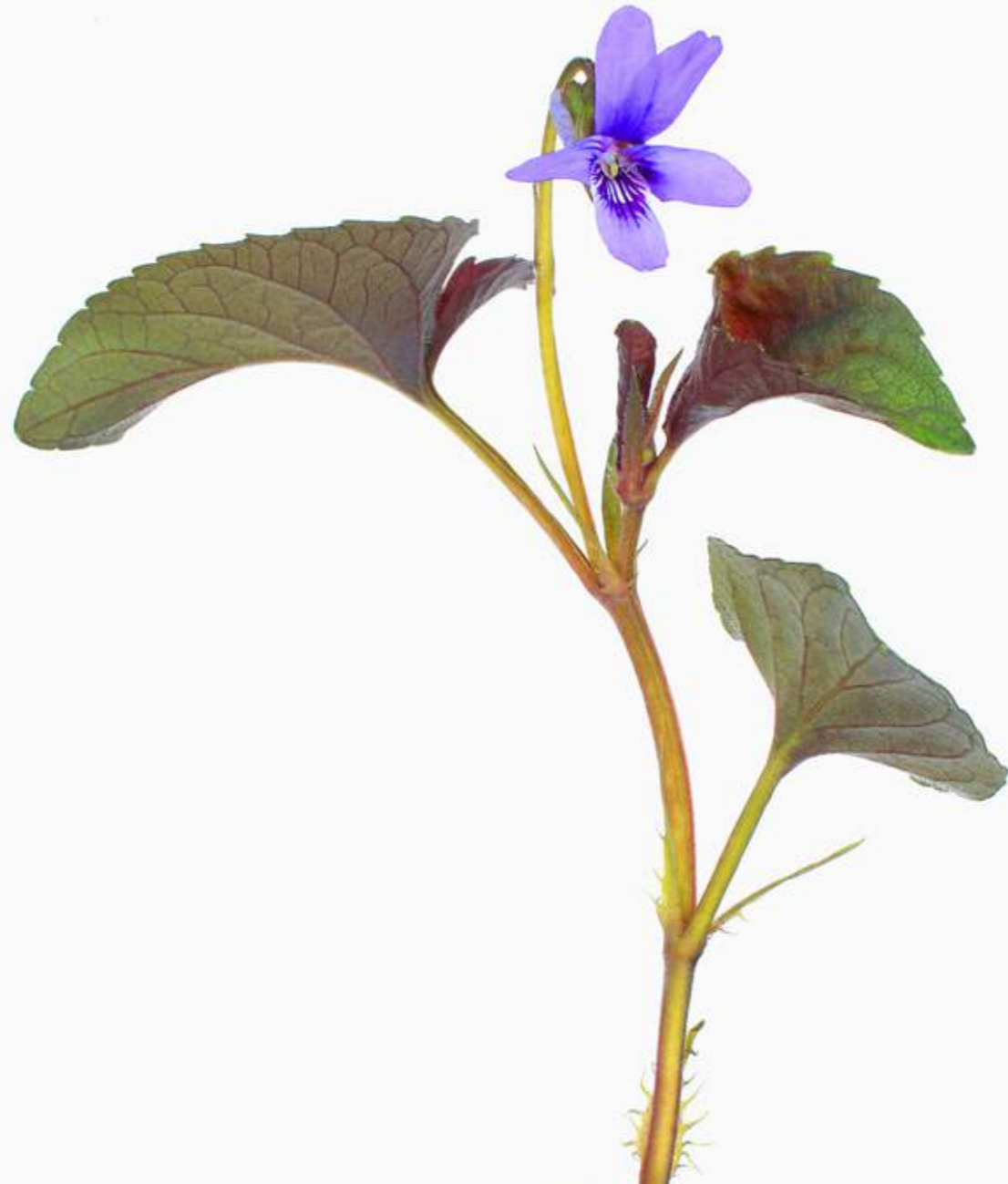
Viola labradorica 'Purpurea'

Die Kinder haben die Veilchen gepflückt, all, all, die da blühten im Mühlengraben. Der Lenz ist da; sie wollen ihn fest in ihren kleinen Fäusten haben.