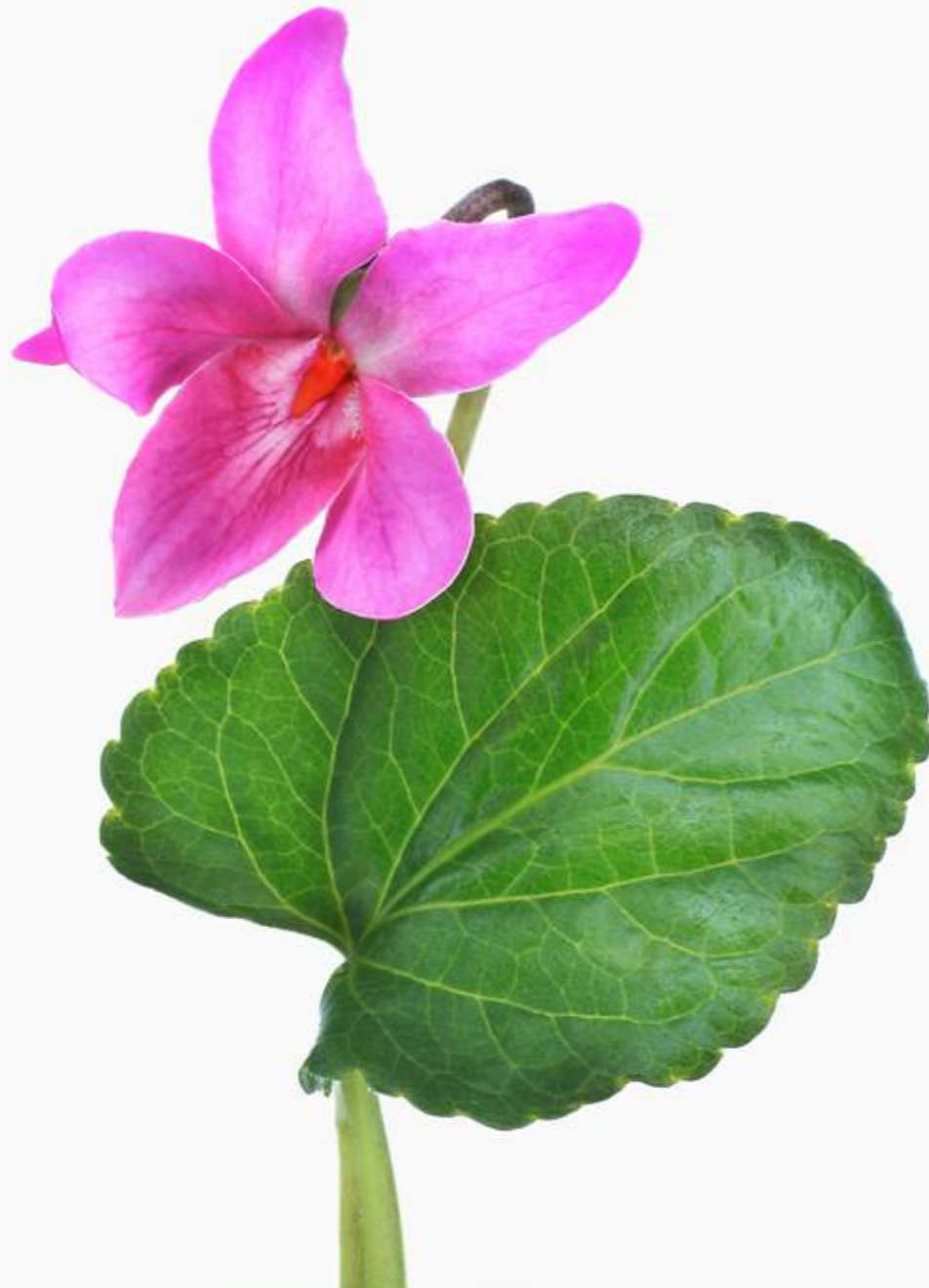
Viola odorata 'Classy Pink'