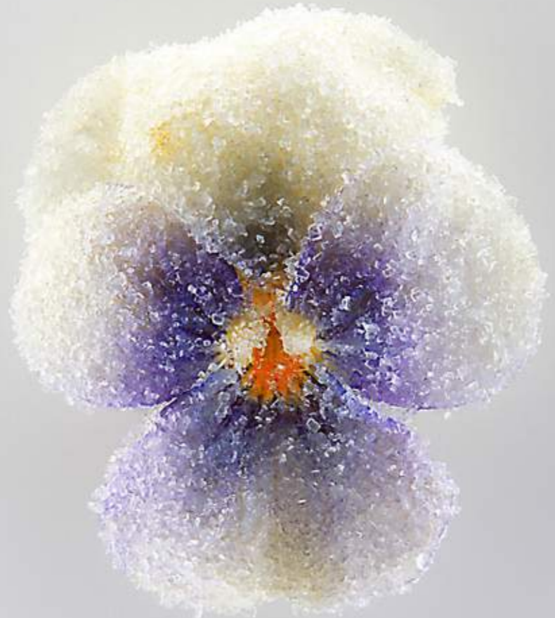
Kandierte Hornveilchen ( Viola cornuta -Hybriden)