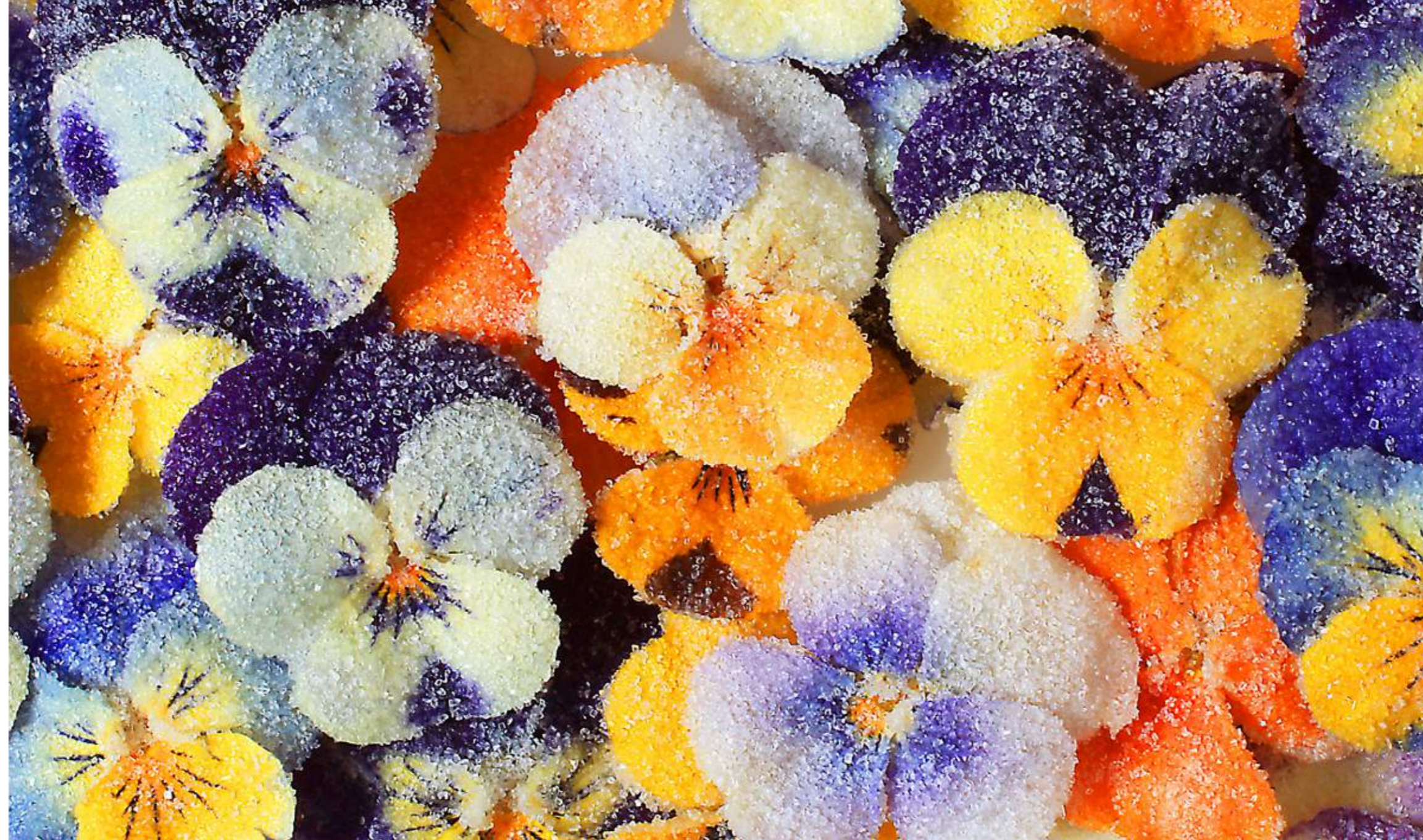
Kandierte Hornveilchen ( Viola cornuta -Hybriden)