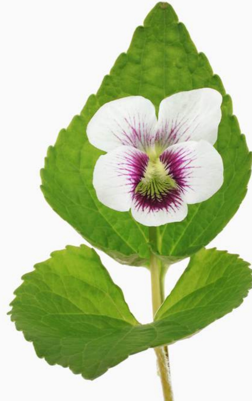
Viola cucullata 'Alice Witter'

Pfingstveilchen. Diese Sorte ist wohl eine der Schönsten im Bereich der Pfingstveilchen. Die Blüten sind groß und weißblühend. Von der Mitte aus scheint es wie ein intensiv rosarotes Herz, welches sich in rosaner Aderung nach außen zieht. 'Alice Witter' ist sehr robust, frohwüchsig und blüht von April bis Juni.