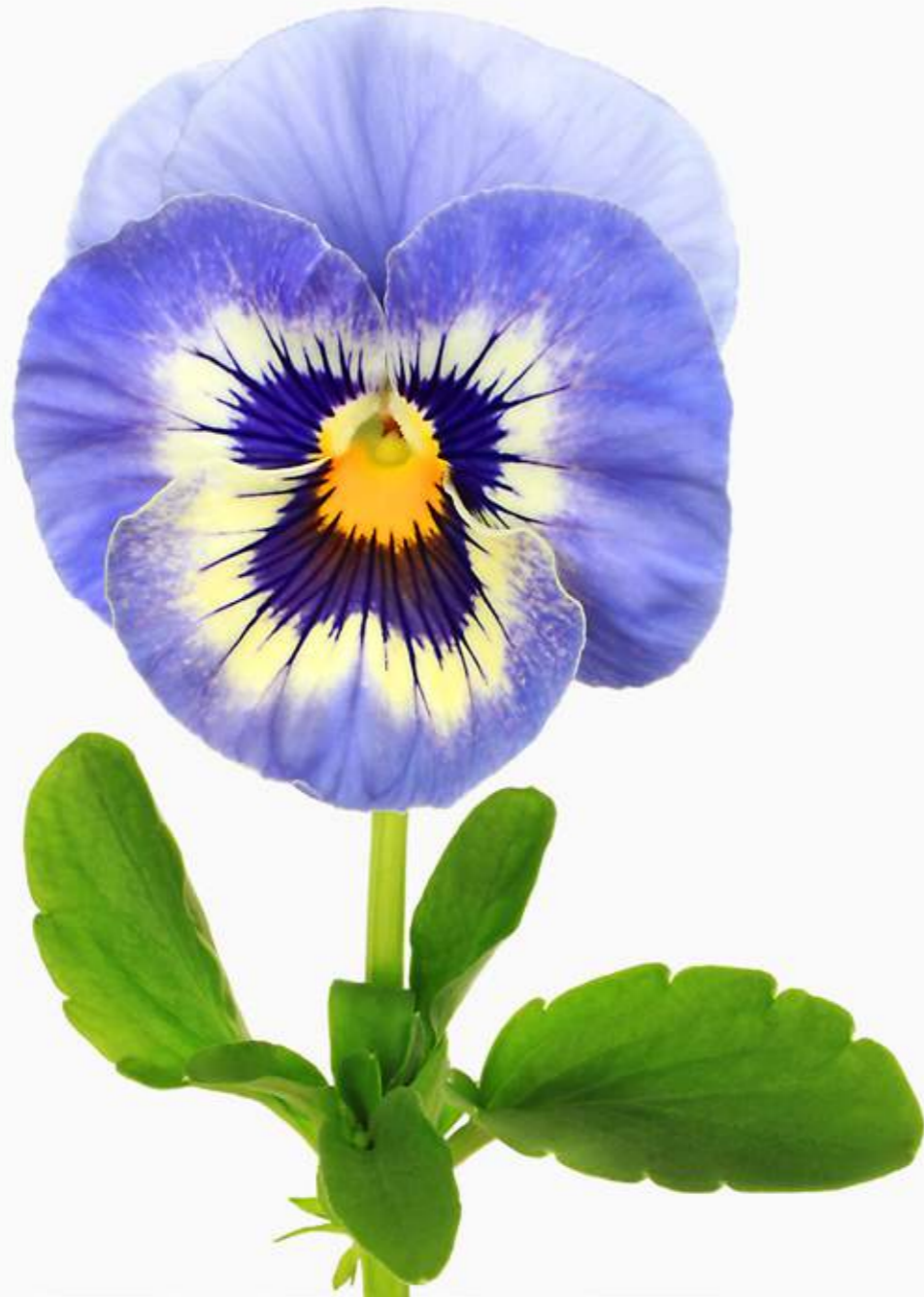
Viola x wittrockiana -Hybride

Das Viola tricolor , das wilde Stiefmütterchen heißt so, weil jedes der gelben Blätter unter sich ein schmales, grünes Blättchen hat, wovon es gehalten wird, das sind die Stühle, welche die Mutter ihren rechten lustigen Kindern gegeben hat, oben müssen die zwei Stiefkinder in dunkelviolettblau trauernd stehen und haben keine Stühle.