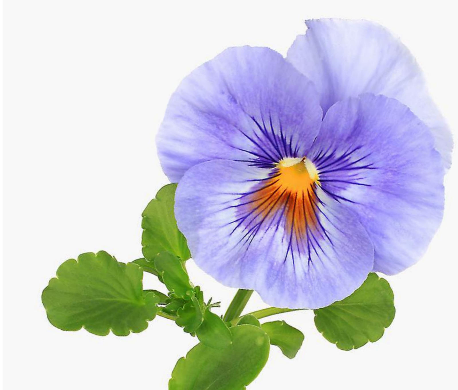
Viola x wittrockiana -Hybride

Eine alte Geschichte des Naturschriftstellers Friedrich Schnack (1888-1977) besagt: „Das große unterste Blumenblatt, gestützt auf zwei Kelchblätter, ist die Stiefmutter, ihr zu Seiten sitzen auf je einem Stühlchen die beiden gutgekleideten eigenen Kinder, zuoberst die zwei schlichten Stiefkinder, die zusammen mit einem Stühlchen vorliebnehmen müssen. Der bedauernswerte Vater wird durch den Blumenstempel veranschaulicht. Infolge des Unfriedens in seiner Familie hat er weißes Haar bekommen, vor Kummer verkriecht er sich in seinen Fuhsack, aus dem er kaum herauschauen kann. Er kommt erst zum Vorschein, wenn die anderen „ausgegangen“ sind, d. h. abgefallen sind.“