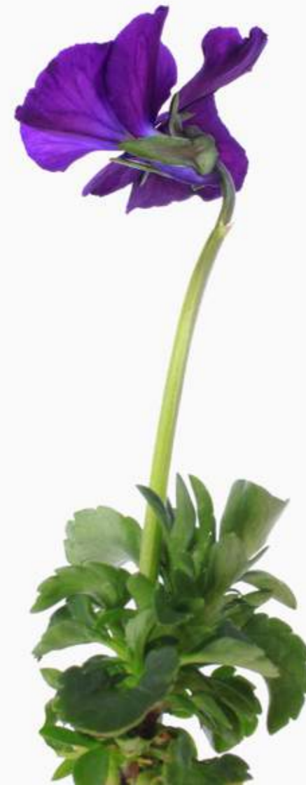
Viola cornuta 'Roem van Aalsmer'

Garten-Hornveilchen. 'Roem van Aalsmer' ist eine klassische und alte Züchtung aus den Niederlanden. Die 15 cm hohen Blüten sind leicht gerüscht und leuchten in einem dunklen Blauviolett mit einem ganz kleinen gelben Auge. Durch ihre eintönige Farbe, wirkt diese Sorte fast ein wenig langweilig oder altmodisch. Sie hat sich aber einfach bewährt, ist sehr robust, unempfindlich und gut winterhart – auch in höheren Lagen.