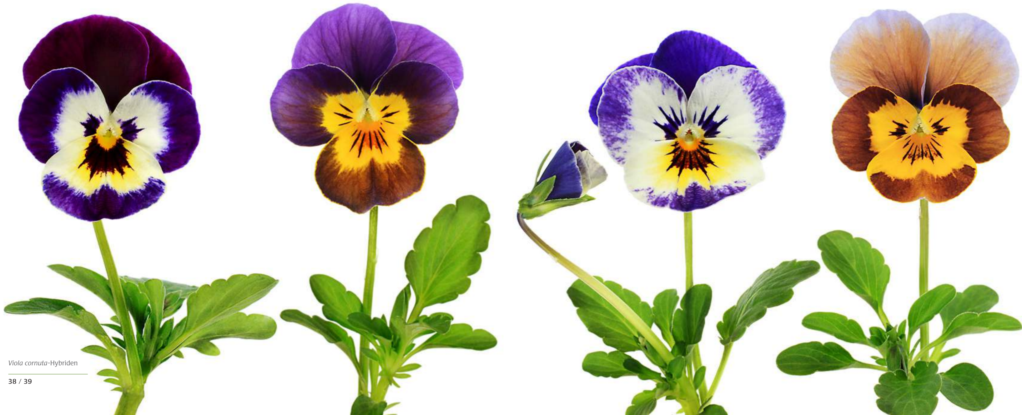
Viola cornuta -Hybriden